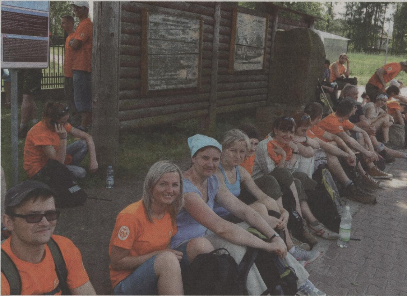
Uczestnicy tegorocznego jubileuszowego zjazdu w Strawczyźnie.